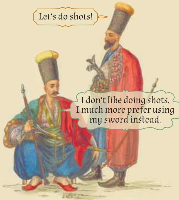
Tatars, Russian book