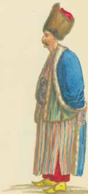
Boznan in Mirvan