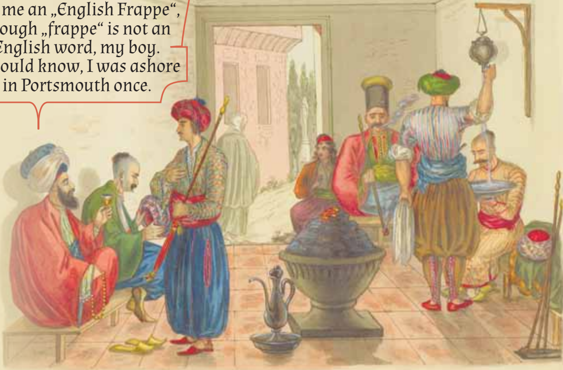
Interior d'un café Turc. 1826. Comptoir d'Inde

Get me an „English Frappe“, though „frappe“ is not an English word, my boy. I should know, I was ashore in Portsmouth once.